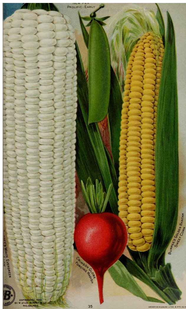
Les variétés de maïs doux 'White evergreen' et 'Golden Bantam' - Catalogue W. Atlee BURPEE, Philadelphia, 1904, 35.

'Golden Bantam' est une variété hâtive (70-80 jours) avec épis à huit rangs. C'est une variété qui convient bien sous nos latitudes septentrionales. C'est une variété saine et productive.